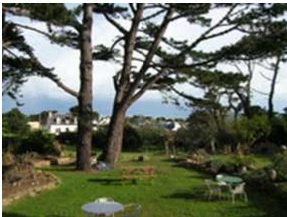
Centre le Carnet de Bord

Les repas sont préparés par le maître du lieu qui propose une cuisine goûteuse avec produits locaux et poissons